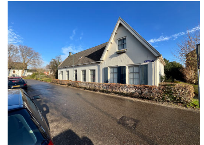
De Montignylaan 28