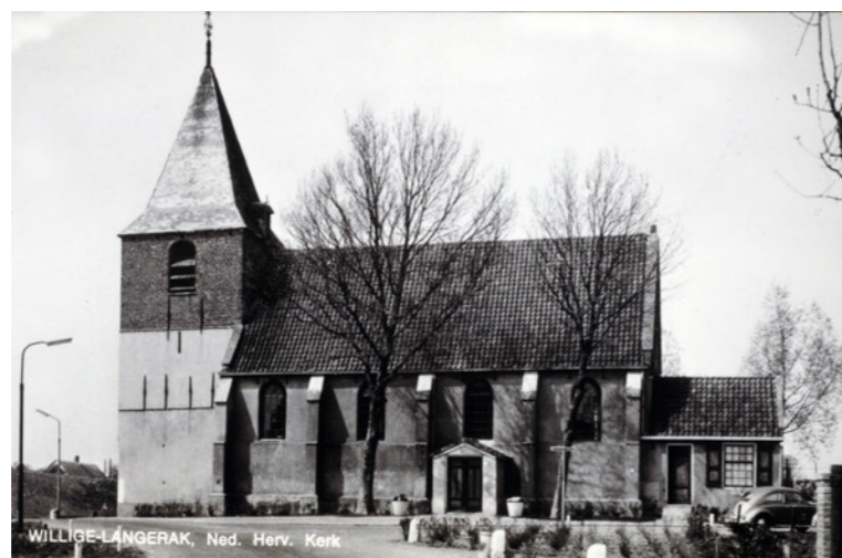
WILLIGE LANGERAK, Ned. Herv. Kerk