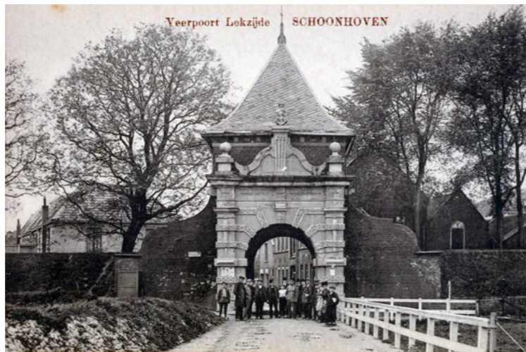
Buiten de Veerpoort