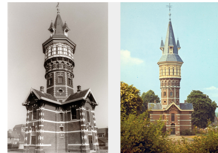
Bij de Watertoren 23