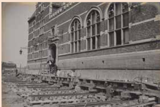
Links: gebouw van station Antwerpen-Dam, op rails, 1907