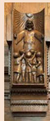
Twee galerij-tafereelen: 'De ark van Noach' en 'Jezus zegent de kinderen'