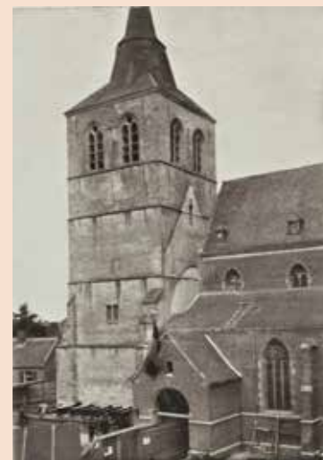
Onder: de op rails staande kerktoren van Bocholt is al iets verplaatst, 1910

Jan Kortland nam uit eigen beweging contact met het tweetal op, om de kerk en de