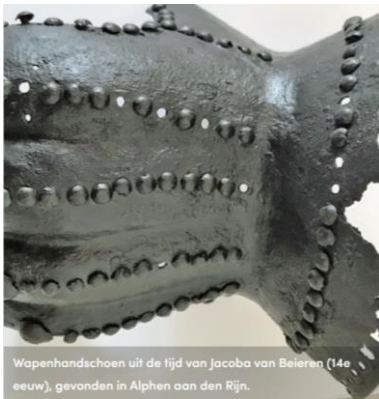
Waphandschoen uit de tijd van Jacoba van Beieren (14e eeuw), gevonden in Alphen aan den Rijn.

Afgelopen week is de tentoonstelling 'Strijd in de graventijd' in het Archeologisch huis Zuid-Holland in Alphen aan den Rijn. De tentoonstelling vertelt de vergeten geschiedenis van oorlogvoering in het Middeleeuws graafschap Holland. Topstukken zijn twee zeldzame waphandschoenen uit 1426 die destijds verloren zijn bij de slag om Alphen aan den Rijn.