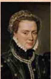
Margaretha van Parma

In het najaar van 1572 werd Schoonhoven veroverd door Willem van der Marck, Heer van Lumey, een beruchte en wrede geuzenleider. De verovering van Schoonhoven kwam niet zomaar uit de lucht vallen. Het conflict was al veel eerder ontstaan.