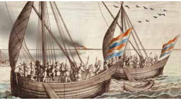
Watergeuzen uit Dordrecht op de Lek

Nadat Den Briel in 1572 door de watergeuzen veroverd was, kozen meer steden in Holland en Zeeland de zijde van de Prins van Oranje. Hij werd in dat jaar door de Staten van Holland benoemd tot stadhouder en hij benoemde op zijn beurt op 20 juni 1572 de watergeus Willem van der Marck, Graaf van Lumey tot zijn luitenant in Holland. De staten van Holland drongen er bij Lumey op aan de stad Schoonhoven – die immers voor Filips II had gekozen – te bezetten. Eind september trok hij met 24 vendels naar Schoonhoven en belegerde de stad. Om te voorkomen dat de Spanjaarden de stad konden ontzetten, werd de Lekdijk aan weerskanten van Schoonhoven doorgestoken en van schansen