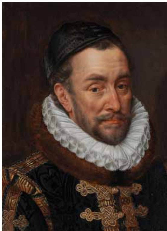
Portret van Willem I, Prins van Oranje, ca. 1579 door Adriaen Thomasz Key