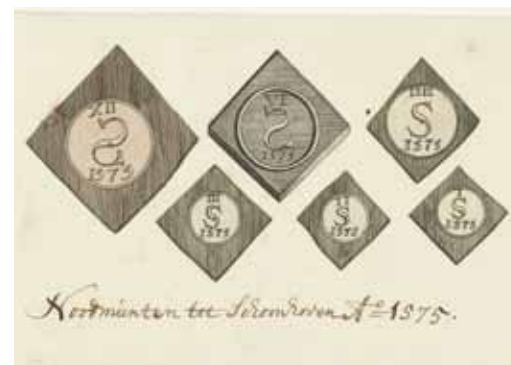
Ad de Vaal

De la Garde beschikte niet over voldoende geld om zijn soldaten te kunnen betalen. Hij liet daarop tinnen noodmunten slaan.