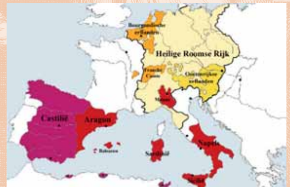
Het Heilige Roomse Rijk en de erflanden van Karel V tegen het eind van zijn regeerperiode

De smeulende onvrede met het bestuur in Brussel escaleerde en leidde in augustus 1566 tot de Beeldenstorm. In veel kerken werden