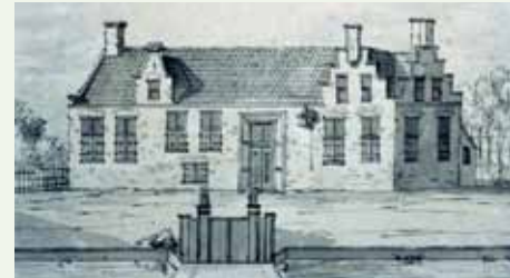
Hottingastate in Pietersbierum