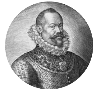
Maximiliaan van Hénin-Liétard (1542-1578), graaf van Bossu

Totaal van de hele compagnie 312 personen