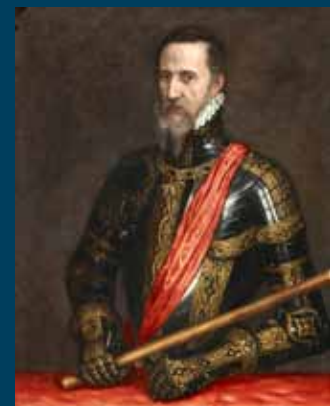
Duc d’Alva (de hertog van Alva), oprichter van de Bloedraad in 1567 in Brussel

Deze laatste komt ook voor op die lijst van de Bloedraad. Jan Cluyt, in wiens huis kerkdiensten werden gehouden, stond ook op die lijst. In één van die diensten verbond Pieter Jansz in 1566 een stel uit Gouda in het huwelijk.