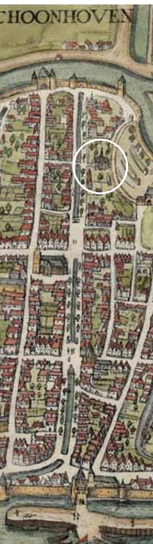
In de cirkel het Sint Elizabethklooster (detail kaart Guiciardini)