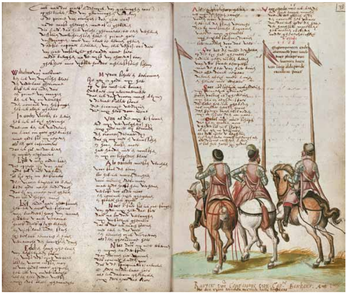
“Den coninck van Hispangien heb ick altyt gheehrt”, handgeschreven versie van het Wilhelmus uit 1568 dat, getuige de slottekst, is vervaardigd door Philips van Marnix, heer van Sint Aldegonde