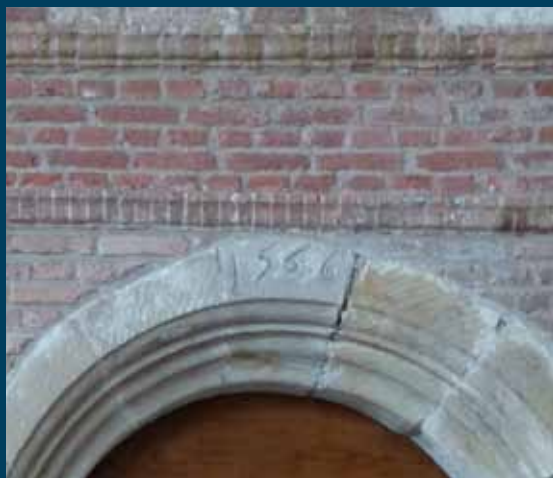
Boven de huidige consistoriekamer staat 1566, het jaar waarin dit poortje naar het kerkhof (de dood) werd omgebouwd tot ingang naar de sacristie (het leven); Pieter Jansz moet hierbij betrokken zijn geweest