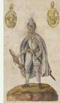
Een geus met geuzenpenning