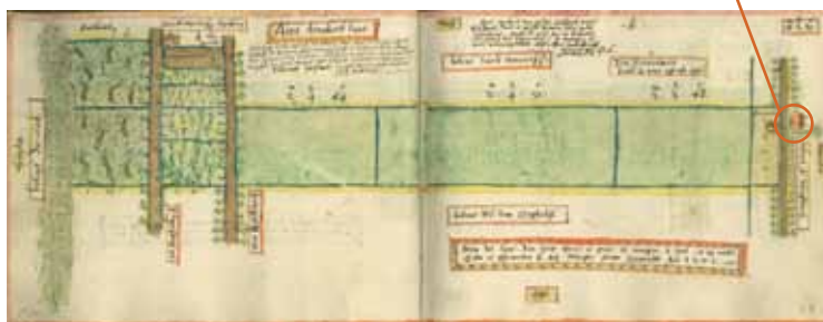
Aert Donckers land