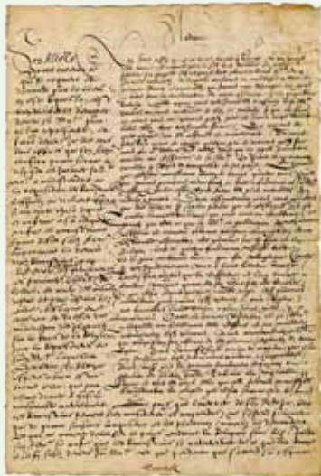
Begn van het Smeekschrift der Edelen