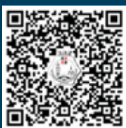
Scan de QR voor het uitgebreide verhaal, namenlijst Inquisitie en literatuurlijst