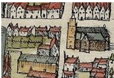
Detail van de Guicciardini-kaart van 1612 waarop het Duitse Huis is afgebeeld.