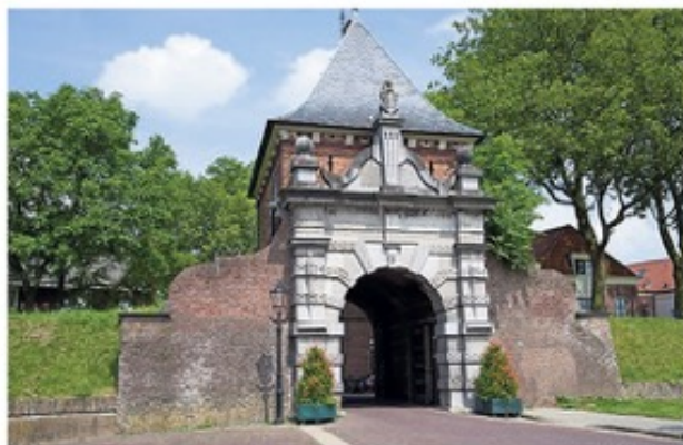
De eeuwenoude Veerpoort, icoon van vestingstad Schoonhoven.

Tijdens het Nazomerfestival start op 15 september om 13.30 uur bij de lage steiger bij Brasserie de Veerpoort een vestingwandeling door Schoonhoven. Het volledige programma van de vijf weekenden vindt u op www.nazomerfestival.info .