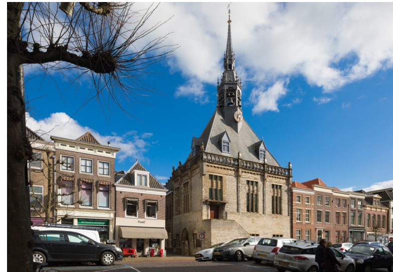
De parkeerplaats op de Steenen Brug, op de achtergrond het stadhuis

Ten aanzien van de cultuur-historische thuisbasis hebben wij aan het gemeentebestuur laten weten geïnteresseerd te zijn in het gebruik van het voormalige Dienstencentrum aan het Doelenplein. Wij hopen in 2020 hierover het gesprek met het gemeentebestuur te kunnen voeren. Het is helaas in 2019 niet gelukt om - zoals het plan was - een minisymposium te organiseren over de verduurzaming van monumenten. Het ligt in de bedoeling dit nu in 2020 te organiseren. Over de relatie met de gemeente is hiervoor al eea. geschreven.