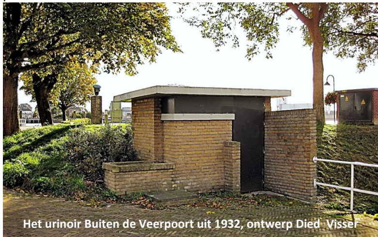
Het urinoir Buiten de Veerpoort uit 1932, ontwerp Died Visser

Er is in december 2019 overlegd met de indieners van het burgerinitiatief mannenplashuis. Het bestuur van de HVS ondersteunt de wens het kleine monument te herstellen en een functie te geven en heeft aan de initiatiefnemers de gedachte meegegeven om het nieuwe gebruikt in de aanpak van het hele terrein te bezien.