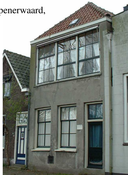
R.Kappers Schoonhoven, 23 juni 2009

Niets uit deze uitgave mag worden verveelvoudigd en/of openbaar worden gemaakt door middel van druk, fotokopie, of op welke wijze dan ook, zonder toestemming van de schrijver. Bestellingen door overmaking van € 25,- op giro 1459985, t.n.v. R.Kappers, Schoonhoven, o.v.v. Zilvercahier nr.6.2 De opbrengst komt geheel ten goede aan het werk van de Historische Vereniging