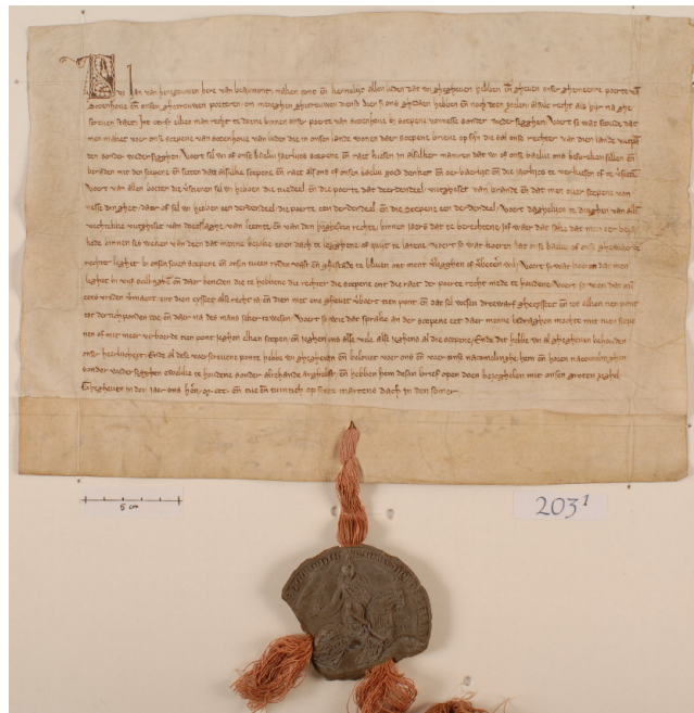
Afbeelding 1. Oorkonde uitgevaardigd op 4 juli 1322 door Jan van Henegouwen, heer van Beaumont (OAS Inv.nr.203-1).

De vorm en de inhoud van de overdracht van ‘overheidsgezag’ door de heer waardoor een stad een eigen wetgevende bevoegdheid krijgt, het keurrecht, laat zich echter letterlijk raden. Een systematisch onderzoek naar vorm en inhoud van een dergelijke overdracht ontbreekt tot heden in de literatuur. Deze omissie heeft mogelijk ook Hugenholtz in 1981 parten gespeeld.